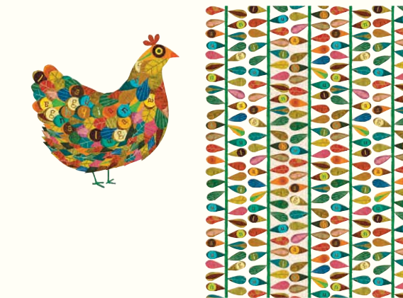
Ilustrações de André da Loba (para o livro Los 7 Hermanos Chinos , 2011), Teresa Lima ( Os Sete Cabritinhos , 2008), André Letria ( Se Eu Fosse Um Livro , 2011) e Gonçalo Viana ( Esqueci-me Como Se Chama , 2011)

Edições Eterogéneas - vão, no entanto, estar presentes com stands próprios na feira.