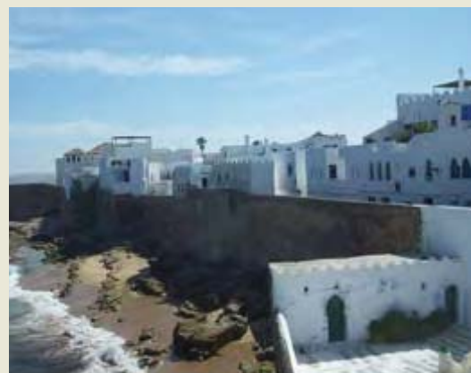
Arzila Frente de mar.

«Não tenho dúvidas que os primeiros grupos que sairão desta licenciatura terão hipóteses de encontrar um emprego, o que não é evidente para os estudantes que se licenciaram noutras línguas já com alguma tradição no país», acrescenta. As motivações para aprender português são, assim, várias, «desde o gosto pela cultura portuguesa até às expectativas de obter um bom emprego com esta formação».