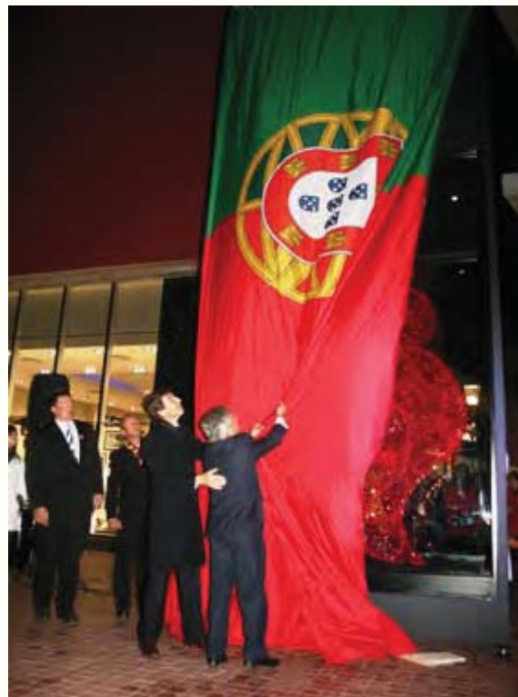
África do Sul Coração Independente Vermelho , de Joana Vasconcelos

Com o apoio do Instituto Camões (IC), realiza-se a 30 de Junho um