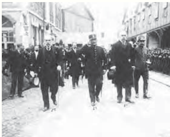
República Visita do Presidente do Brasil, marechal Hermes da Fonseca, a Portugal, 1 de Outubro de 1910.

«As relações profundas e complexas entre os intelectuais portugueses e brasileiros, tanto durante o período republicano português (1910-1926), que corresponde no Brasil à segunda fase da República Velha, como sob os Estados-Novos, de inspiração fascista, português e brasileiro», foi outro dos tópicos do colóquio, que acolheu 37 comunicações. «As trocas de corres-