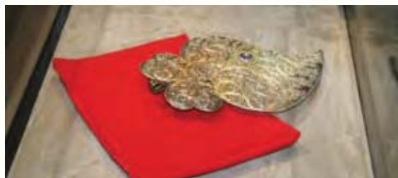
África do Sul Filigrana oferecida a Cristiaan Barnard em 1968

A mostra tem como base o acervo da biblioteca, bem como livros cedidos pelas Ernest Oppenheimer Portuguese Collections, da Universidade de Witwatersrand. Com o título Portuguese Presence in Africa and the East – An Historical Perspective , é acompanhada de um texto de enquadramento histórico da autoria de Isabel Abecasis, do Arquivo Nacional da Torre do Tombo.